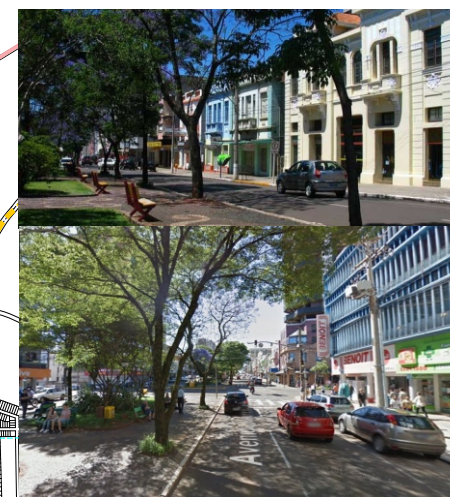
Fig.59- Av. Sete de Setembro