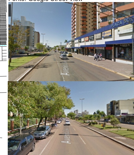
Fig.60- Av. Sete de Setembro